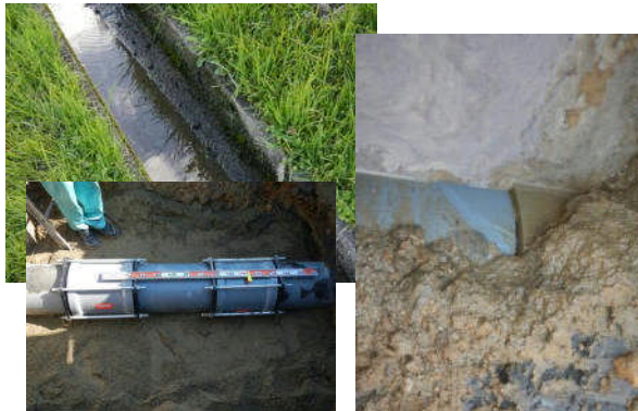
緊急No.2 八百津西分線(上牧野地内) VM管ジョイント部分の漏水補修工事