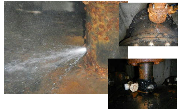
その他補修 坂祝支線(黒岩地内の空気弁) 立上り管電食による漏水補修工事