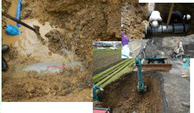
緊急No.1 中山分線(上牧野地内) VM管ジョイント部分の漏水補修工事

連合では管理する農業用水施設において、緊急漏水補修工事2件、通常の整備工事2件、その他補修工事1件を行いました。