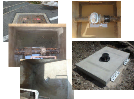
(山之上分線分水弁・マンホール取替工)