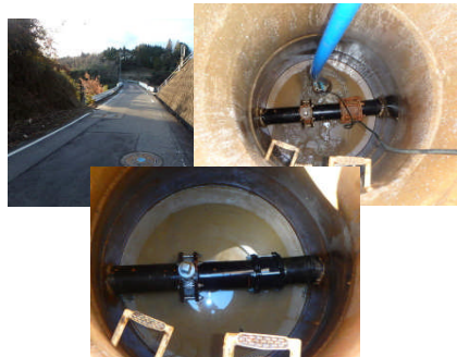
(山之上支線排泥弁工)