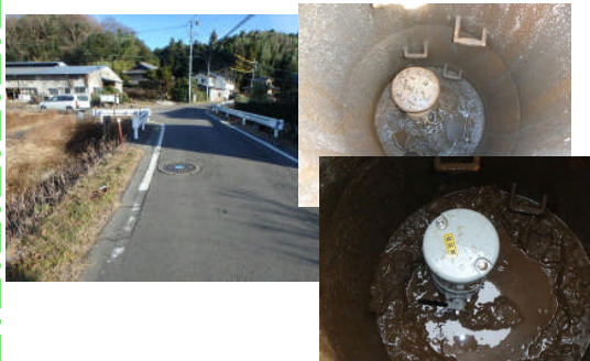
(米田支線空気弁工)