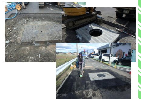
(森山支線マンホール取替工)